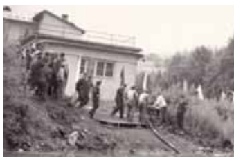
Soutěž Valašský obušek

V roce 1966 se začíná stavět současná hasičská zbrojnice , která byla v roce 1968 dokončena a slavnostně předána do užívání.