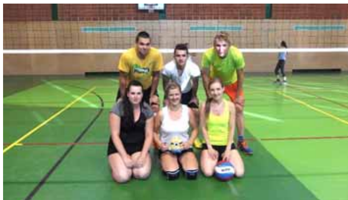
1. místo – Mimoni