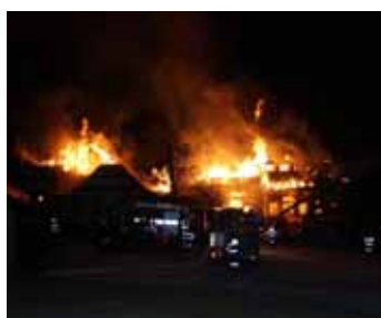
Požár Libušína 3. 3. 2014

V březnu 2014 se rozezněly nejen u nás, ale i v okolních vesnicích sirény. Bohužel nebyla to zkouška, ale rozsáhlý požár na Pustevnách. Hořela architektonická památka Libušín, kde zasahovalo na 13 jednotek.