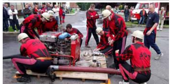
Soutěž o Putovní pohár Cyrila a Metoděje 2011