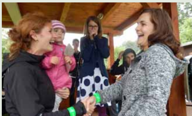
Vítězka soutěže o nejlepší hafeřák