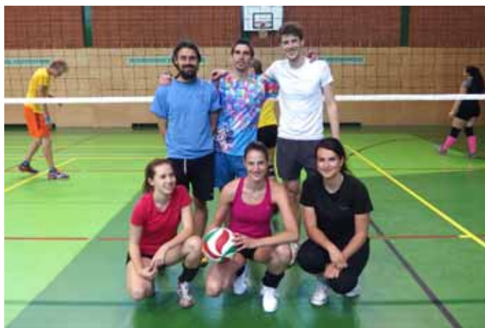
2. místo – Vzhůru dolů