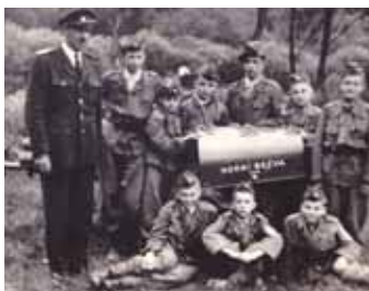
První mládežnické družstvo, rok 1934

Před první světovou válkou vzrostla členská základna na 75 členů. Během první světové války byla činnost sboru velmi omezena.