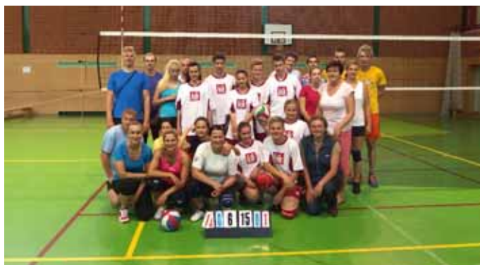
Družstva po zahájení

Text: Marie Němcová