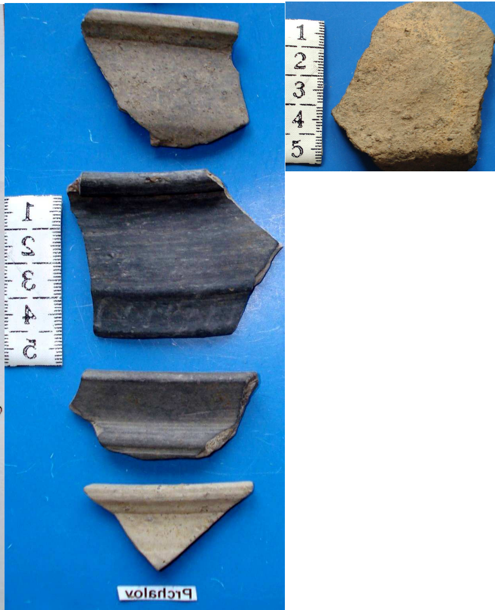
Tabulka II. Nálezy ze sídliště z pozdní doby římské a stěhování národů z Příbora Prchalova. Zlomek nádoby tvarované ve volné ruce (1) a zlomky nádob vytáčených na hrnčířském kruhu (2—5).