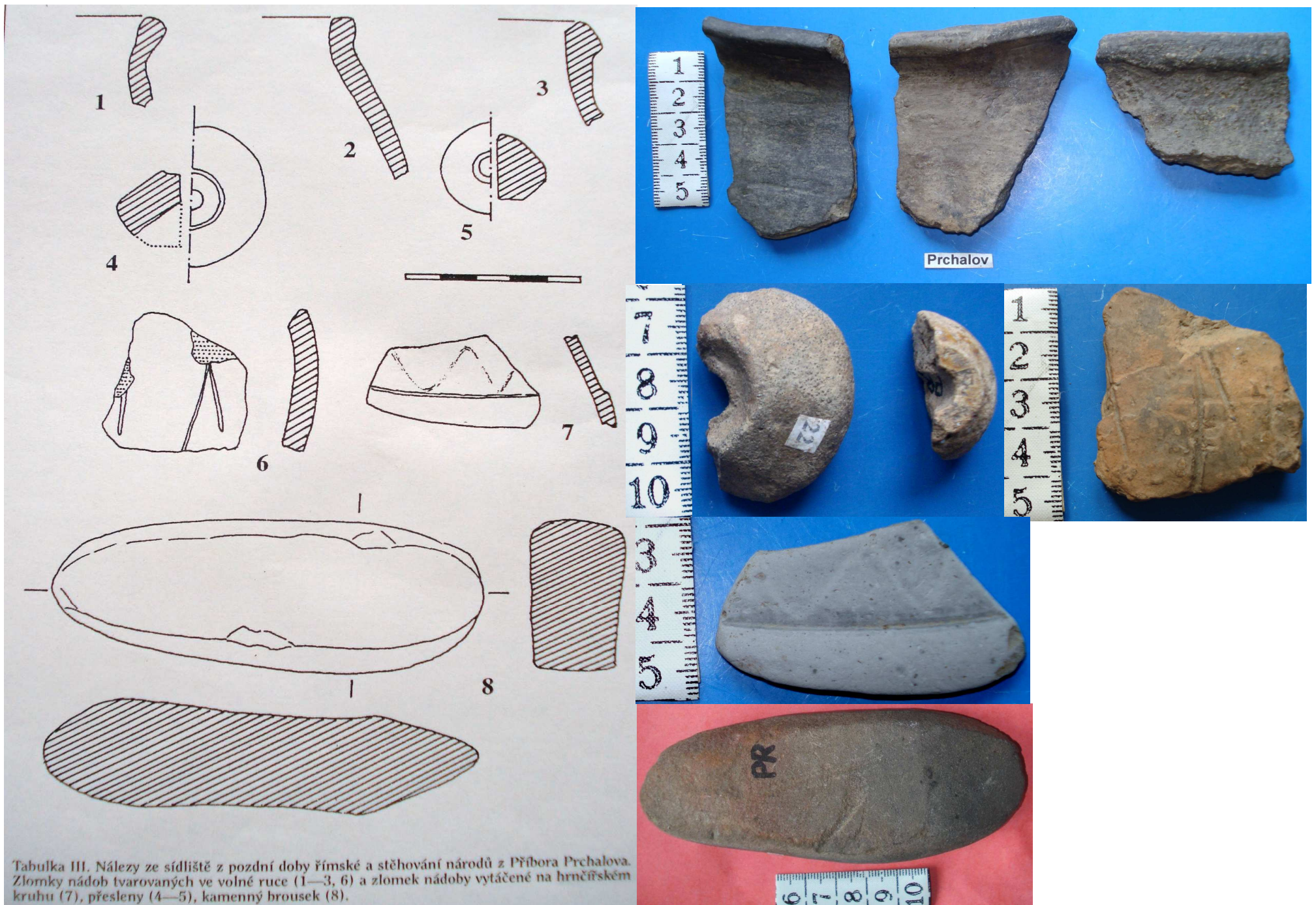
Tabulka III. Nálezy ze sídliště z pozdní doby římské a stěhování národů z Příbora Prchalova. Zlomky nádob tvarovaných ve volné ruce (1—3, 6) a zlomek nádoby vytáčené na hrnčičkém kruhu (7), přesleny (4—5), kamenný brousek (8).