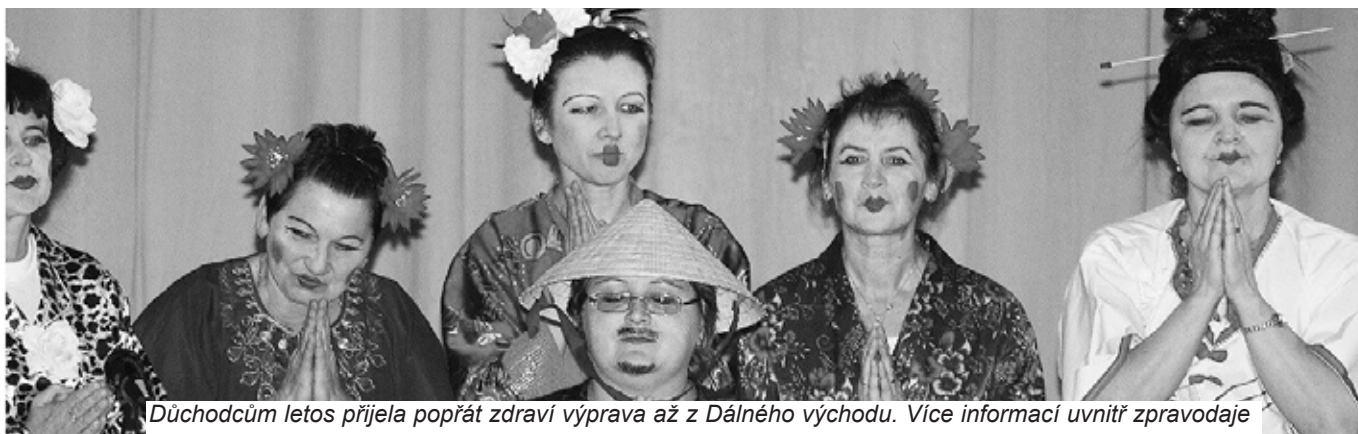
Důchodcům letos přijela popřát zdraví výprava až z Dálného východu. Více informací uvnitř zpravodaje

Pro pronájem výše uvedených sportovišť platí, že přednostně se vykryjí vždy požadavky školy pro výuku dětí a školní sportovní aktivity a teprve následně je možný pronájem veřejnosti. S pozdravem " Sportu zdar"! se na další spolupráci těší R. Řezníčková, zástupce ředitele ZŠ